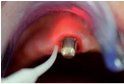
Abb. 3: Taschendekontaminierung an Teleskopzahn mit dem Laser.