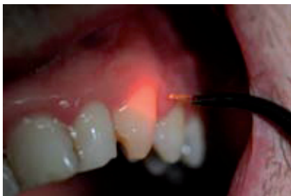
Abb. 6: Laseranwendung bei der Desensibilisierung überempfindlicher Zahnflächen.