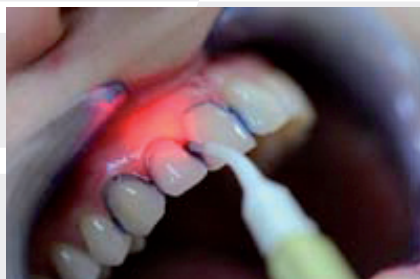
Abb. 1: Antimikrobielle photodynamische Therapie bei marginaler Parodontitis.

Allerdings gibt es nicht ein Gerät für alle Anwendungsgebiete und Indikationen, sondern vielmehr wird die Indikation durch die jeweilige Wellenlänge des Lasers bestimmt. So ist die