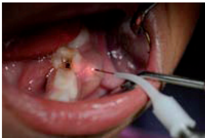
Abb. 5: Laserinzision bei akutem submukösem Abszess im Milchgebiss.