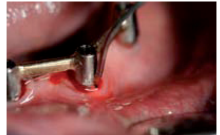
Abb. 2: Laser zur Periimplantitistherapie, 17 Jahre post implantationem und Stegversorgung.

In erster Linie macht man sich allerdings die bakterizide Wirkung einer bestimmten Wellenlänge zunutze. Zahlreiche Studien und Veröffentlichungen aus den verschiedensten Bereichen der Zahnmedizin haben nachgewiesen, dass Laser im Infrarotbereich eine ausgezeichnete antibakterielle Wirkung aufweisen und auch in der Lage sind, bakterielle Toxine zu deaktivieren. Diese Wirkung entfaltet sich bereits bei einer Abgabeleistung, die deutlich unterhalb der Schwelle für eine